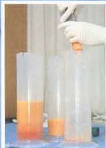
Überflüssig: Das abgesaugte Fett kommt in Plastikbehälter