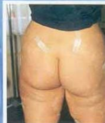
Ende der Prozedur: Die Einschnitte werden mit Pflastern verschlossen