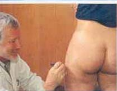
Vorbereitung: Der Arzt markiert die Stellen, wo er die Kanüle einführen wird