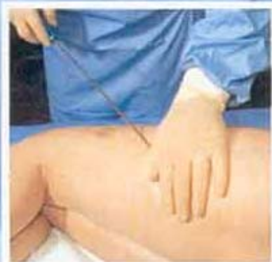
Ran an den Speck: Mit der Kanüle saugt der Arzt das gelockerte Fett ab